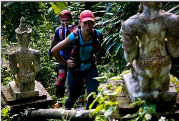
Temple de Wat Palaad