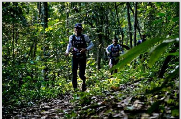
En pleine jungle