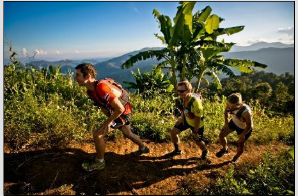
JOUR 2 Vers les sommets