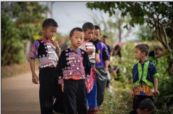
JOUR 1 Villages Hmong