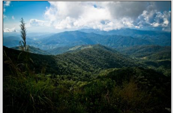
JOUR 2 Les 2 sommets