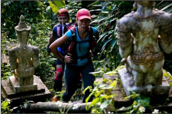
JOUR 1 Temple de Wat Palaad