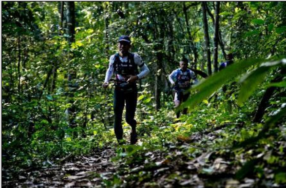
JOUR 1 En plein jungle