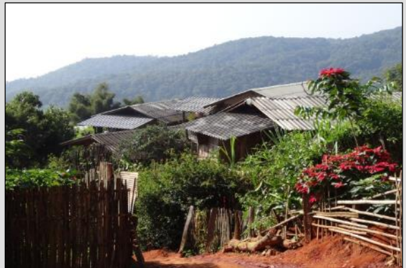
Montagne de Doi Pui