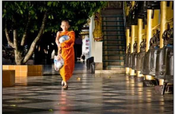
Temple de Wat Doi Suthep