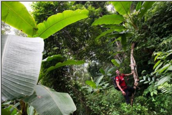
Jungle de Doi Pui