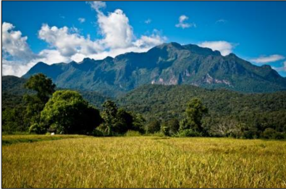
JOUR 1 Au pied de Chiang Dao