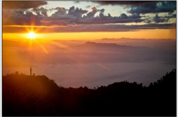
TAG 2 Sonnenaufgang