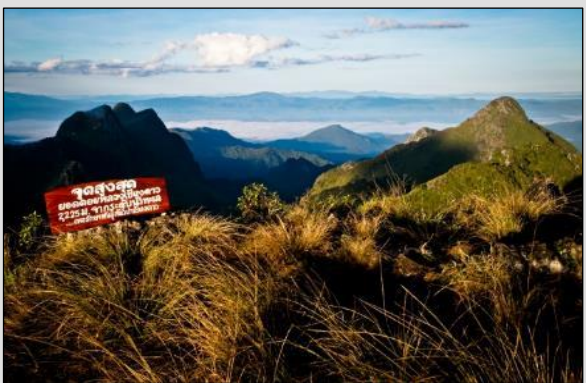
TAG 1 Blick vom Gipfel