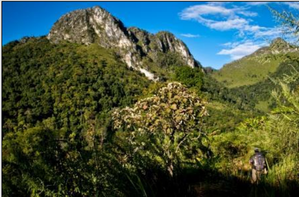
TAG 1 In Richtung Gipfel