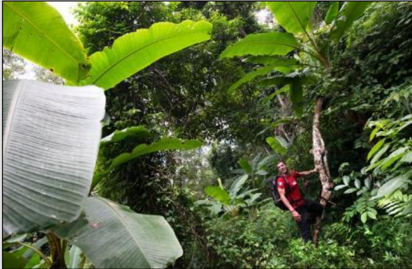
TAG 1 Mitten im Dschungel