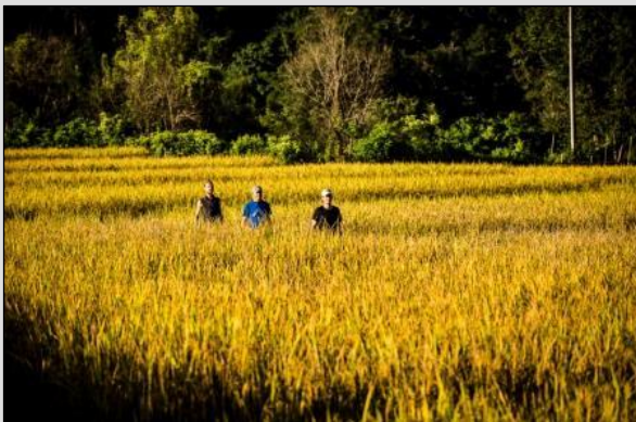
TAG 1 Die ersten Reisfelder