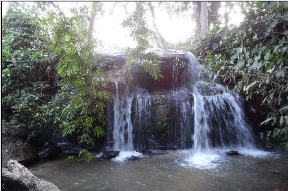
TAG 1 Mittagessen am Wasserfall