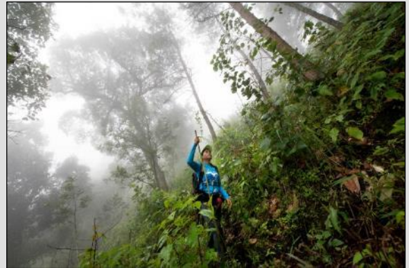
TAG 2 Richtung Gipfel (1450 m)