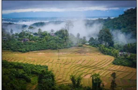
TAG 2 Dorf Karen