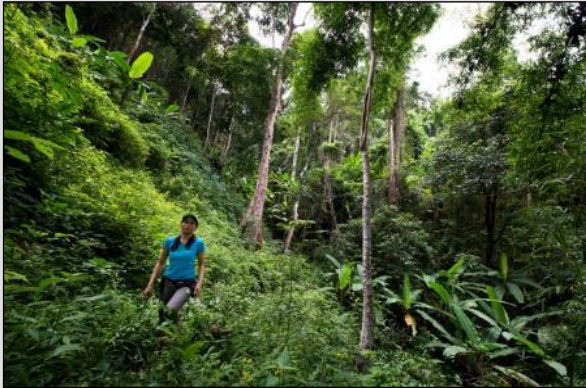
JOUR 1 La jungle de Sop Kai