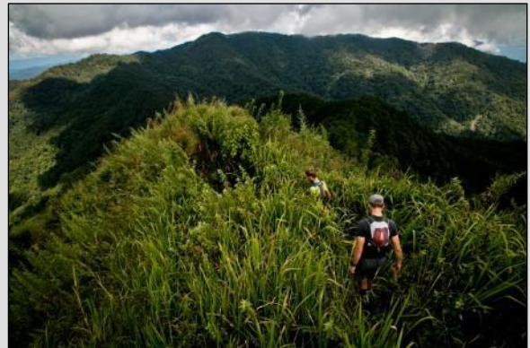
TAG 5 Lahu-Hochland