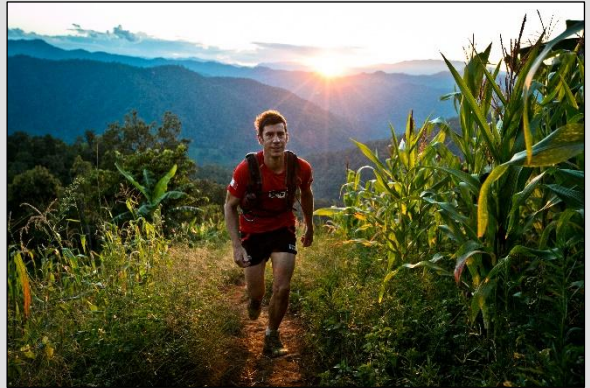
TAG 4 Bergdorf