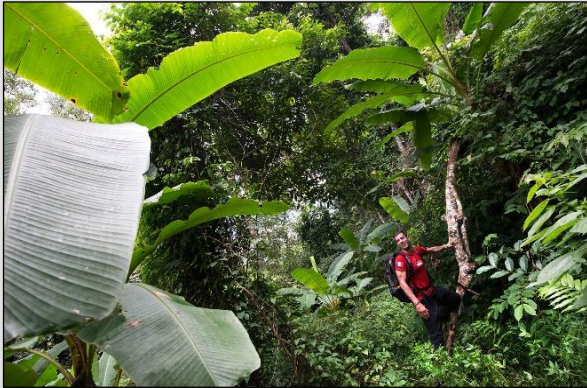
TAG 1 Mitten im Dschungel